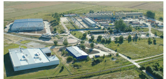
Słupska Specjalna Strefa Ekonomiczna.

Więcej informacji na stronie www.coislupsk.pl , pod nr tel. 59 84 88 466 oraz pod adresem e-mail: d.mikolajczak@um.slupsk.pl lub j.pluta@um.slupsk.pl