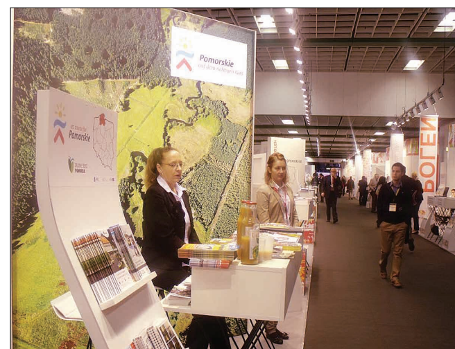
Delegacja z regionu pomorskiego przedstawiła na targach trzy produkty turystyczne.

Targi ITB w Berlinie, jedne z największych targów turystycznych na świecie zgromadziły w tym roku 11 tys. wystawców ze