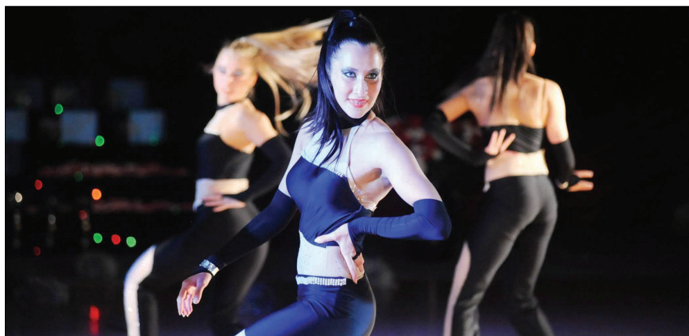
Drużyna ze Słupska.