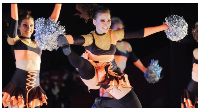
Drużyna z Płocka.