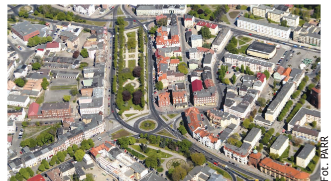
Słupsk z lotu ptaka.