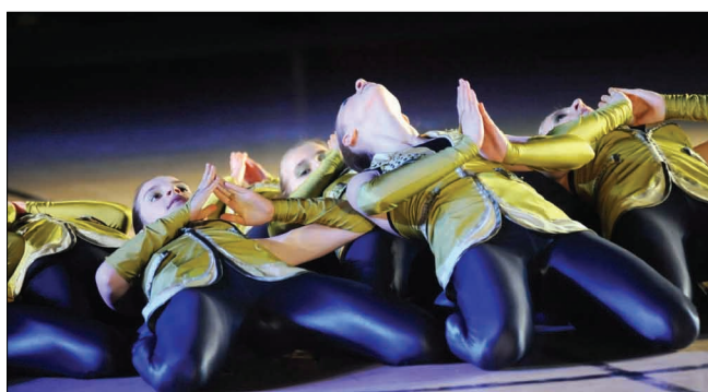
Drużyna z Tuczyna.